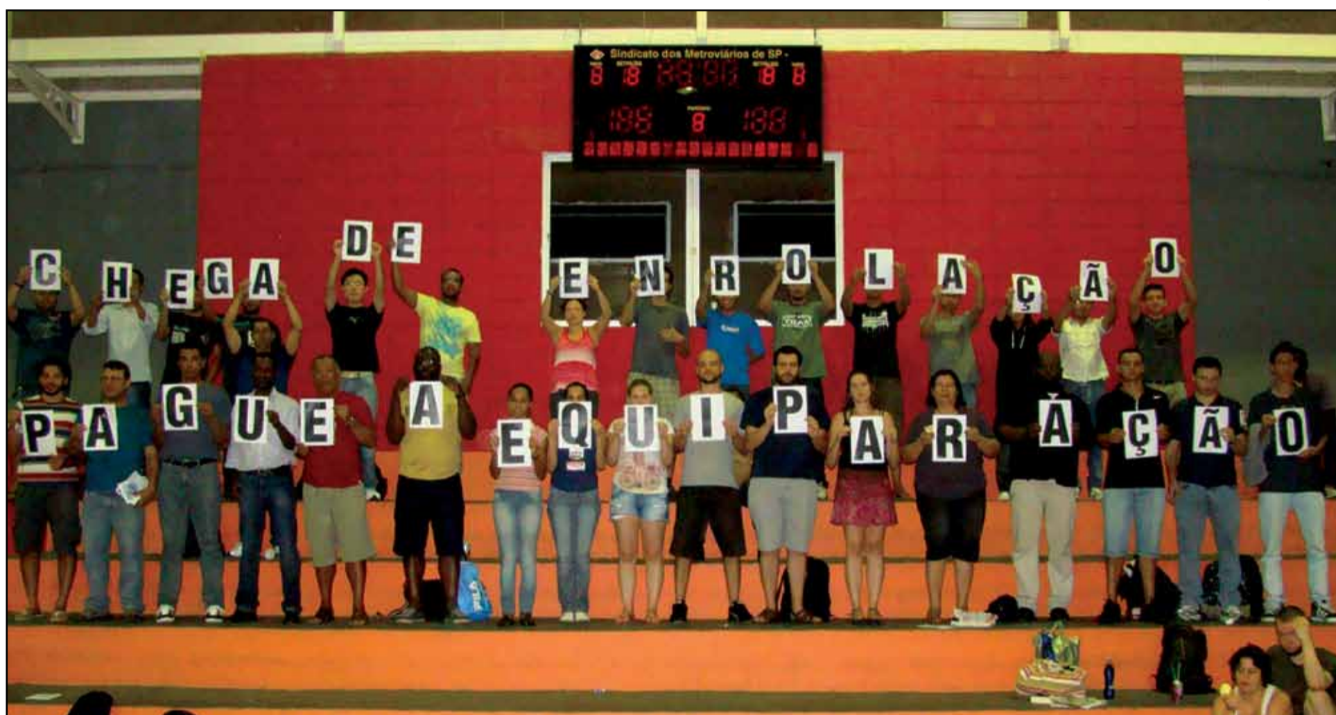
Metroviários demonstram sua insatisfação na assembleia do dia 16

O Metrô considerou como “não elegíveis” 1.146 metroviários da lista dos que exigem a Equiparação Salarial.