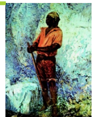
Ilustração de Zumbi dos Palmares, por Antônio Parreiras

No dia 20 de novembro, Dia da Consciência Negra, homenagem a Zumbi dos Palmares, o Sindimetrô/RS, em nome da categoria metroviária gaúcha, saúda os negros brasileiros, manifestando-se sempre contra o racismo, em defesa da cultura afro-brasileira e a favor da igualdade racial em todas as esferas da sociedade.